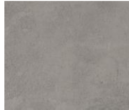
Vinylboden, Concrete Anthracite